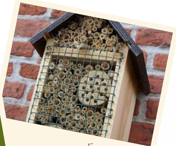
Een bijenhotel: goedkoop, handig en leuk