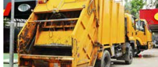
Affligem scoort met afvalbeleid p.3