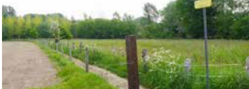
Nieuwe toekomst voor trage wegen p.2