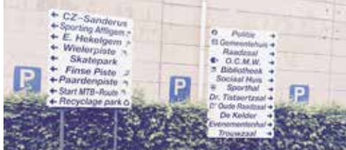
Werken en werven in Affligem p. 2