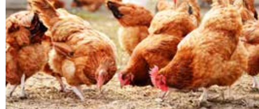
Succesvolle kippenactie p. 3